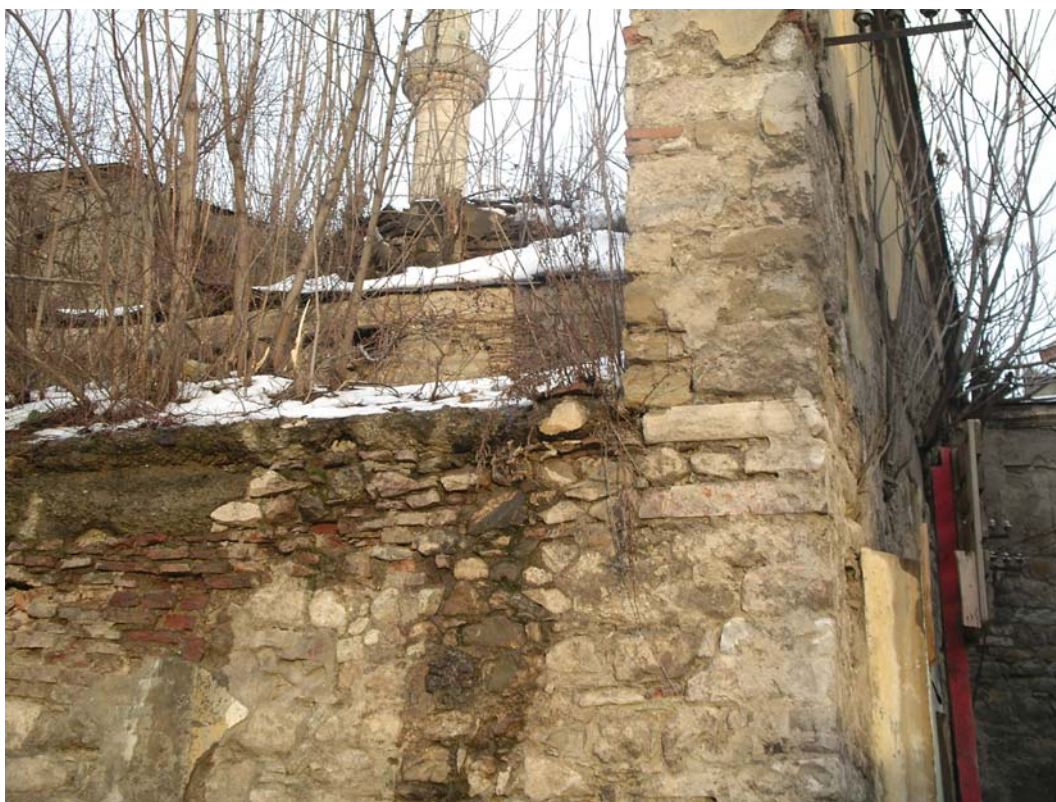
Muri perëndimor i Hamamit të madh – drunjtë e rrënjësuar në mur ilustronë moskujdesin shumë-vjeçar.

Ligji i vitit 1977 nuk është ligj diskriminues, edhe pse nuk është në përputhje me kriteret e sotme evropiane për mbrojtjen e trashëgimisë kulturore. Poashtu, ky nuk është ligj i epokës së Millosheviqit. Deri më tani nuk është miratuar asnjë ligj tjetër që do ta zëvendësonte ligjin e 1977-ës. Kjo do të thotë se ky është ligji në fuqi sot, siç ka qenë edhe gjatë gjashtë viteve të fundit.