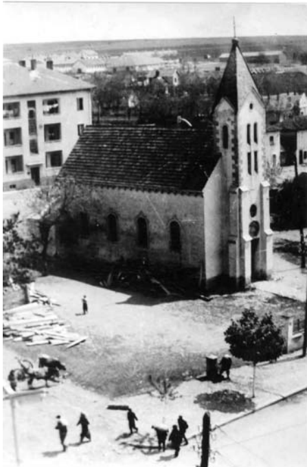
◀Kisha Katolike (përballë Hotel Grandit, sot qendër tregtare)