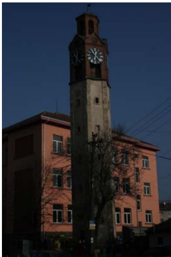
Sahat kulla (me vendim prej vitit 1967)