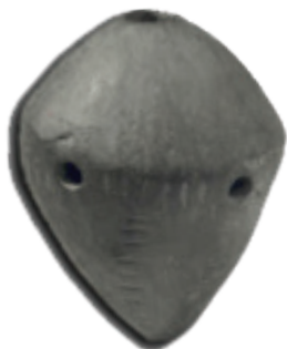
Okarina origjinale e zbuluar në Runik/Rudnik